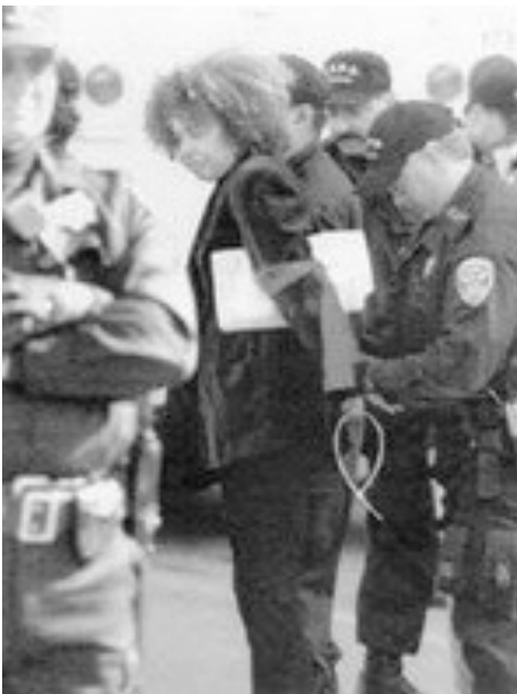
Angela Davies arrêtée en 2000 à San Francisco lors d'une manifestation pour Mumia

Angela Davis: née le 26 janvier 1944 dans l'état d'Alabama où ses parents sont enseignants. Elle étudie aux Etats-Unis, en France et en Allemagne. Elle reçoit sa maîtrise en 1968 et devient membre du Parti Communiste des Etats-Unis et du BPP. Elle commence à enseigner, mais est renvoyée à cause de ses convictions. En 1970, recherchée et arrêtées sous l'accusation de conspiration pour libérer des prisonniers du BPP. Elle passe 16 mois en prison avant d'être acquittée. Aujourd'hui, Angela Davis enseigne à l'université et continue son combat politique et social.