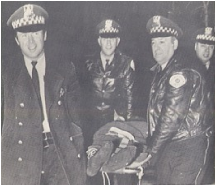
Les policiers, hilares, emportent le corps de Fred Hampton