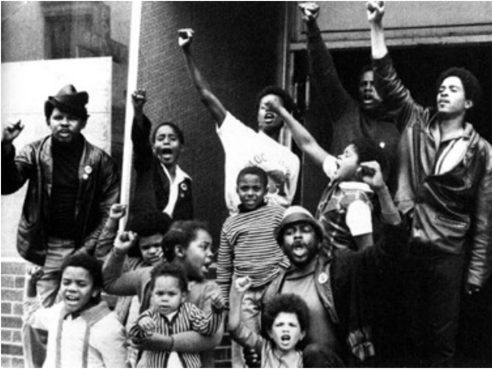
Ecoliers aidés par le programme social du BPP

Tout cela déplaît aux autorités, et dès 1967, le FBI déploie contre le BPP le programme de répression utilisé dans les années 50 contre le Parti Communiste: le COINTELPRO. Le BPP va dès lors être la cible d'une campagne de harcèlement et de répression d'un caractère nouveau et d'une ampleur jusque là inégalée.