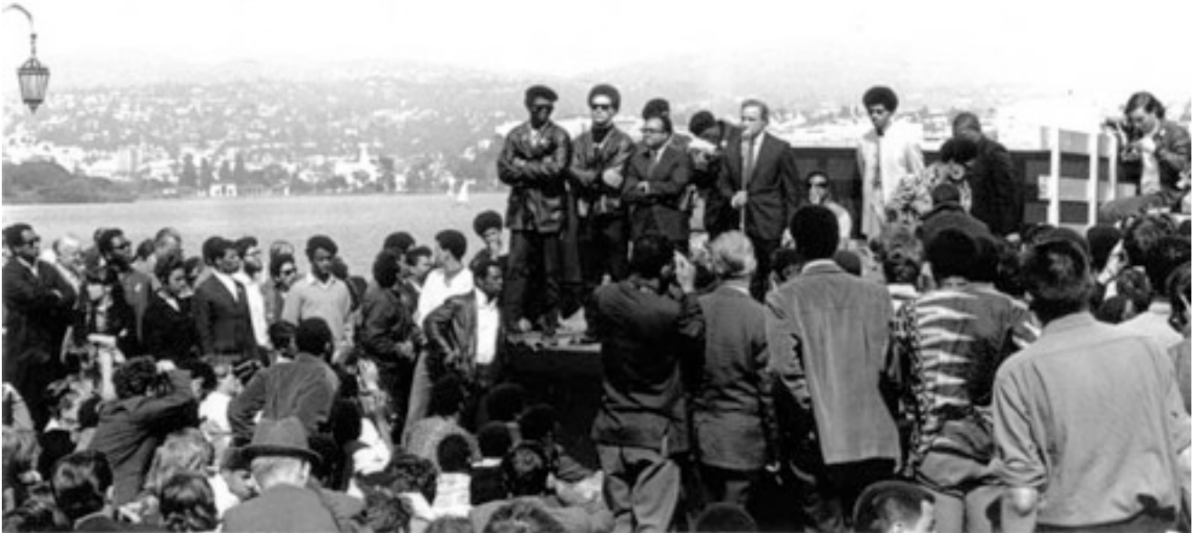
Manifestation d'hommage à Bobby Hutton