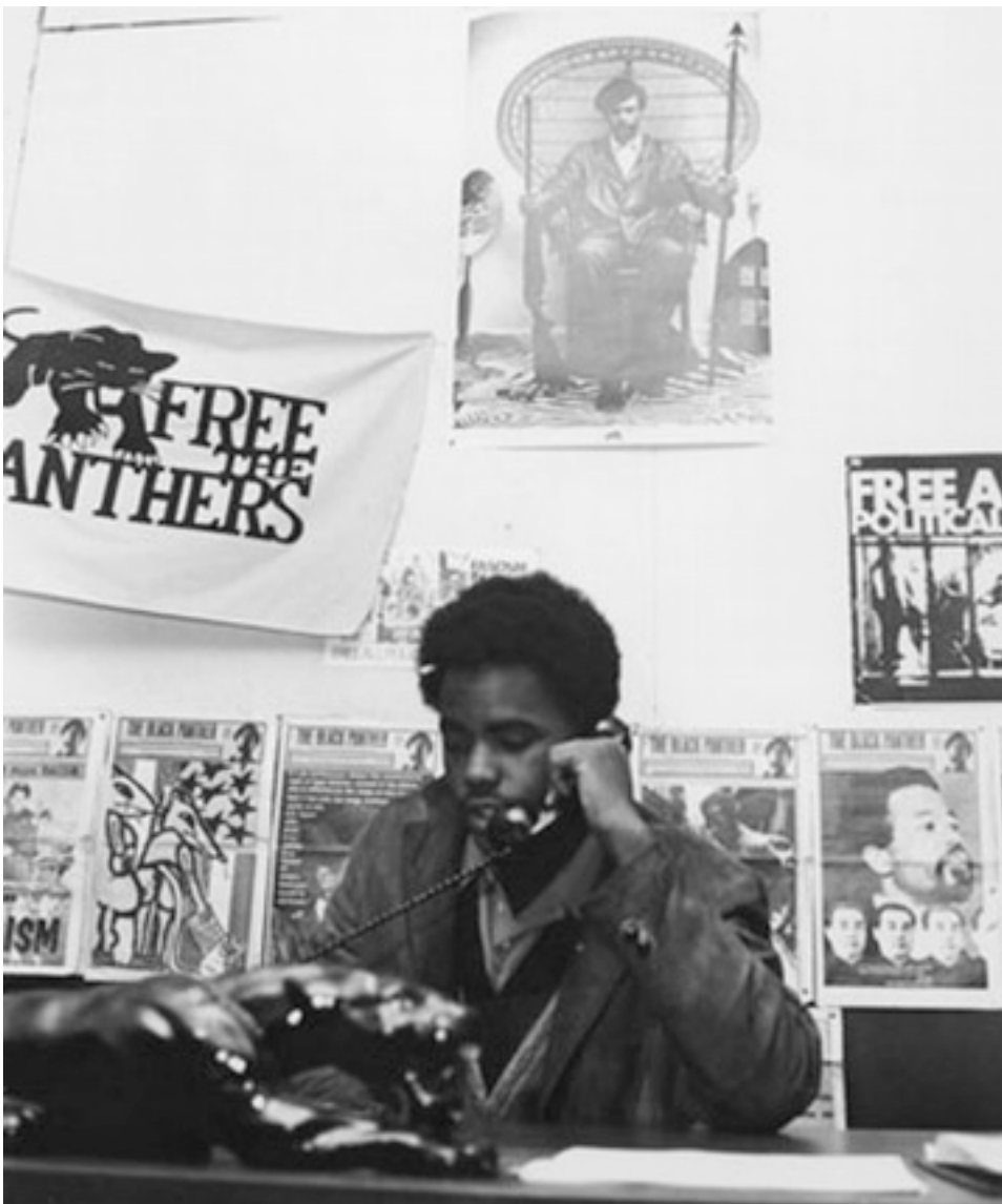
Mumia adolescent, militant du BPP à Philadelphie (1970)

Déjà à l'âge de 14 ans, Mumia est arrêté et battu pour avoir protesté contre un meeting du candidat ultraraciste George Wallace à Philadelphie. Peu après, il est fiché par le FBI pour avoir voulu rebaptiser son lycée 'Malcolm X'. Adolescent, il est l'un des membres fondateurs du Chapitre du Black Panther Party de Philadelphie. En 1969, il est y chargé de l'information. Le FBI le considère comme l'une des personnes « à surveiller et interner en cas d'alerte nationale ».