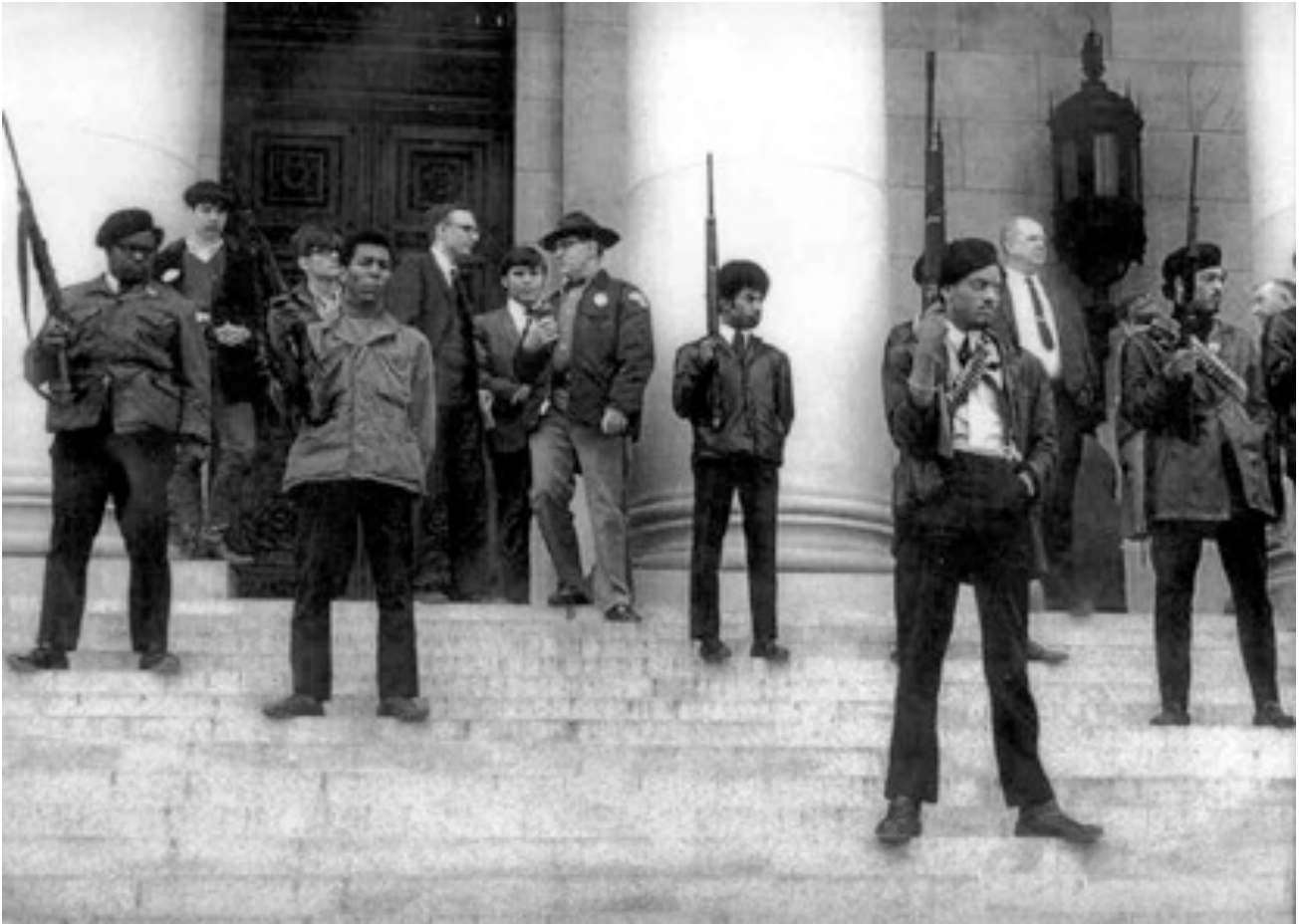
Démonstration de force du BPP à Seattle

En avril 1967, le premier numéro du journal des Panthers sort de presse, suite à l'assassinat d'un jeune noir de San Francisco. Composé de quatre pages, ses textes remettent en question les différents 'faits' établis par la police après la mort du jeune homme.